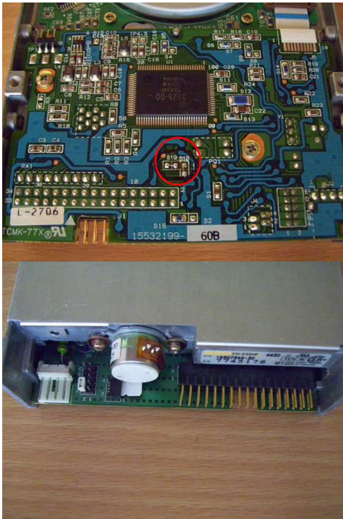
Jumper im Jumperblock auf AB setzen (DS0), alle anderen Jumper entfernen